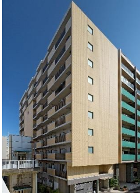
T's garden センター南